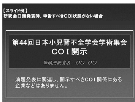
申告すべきCOI 状態がない場合